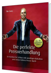
Buch „Die perfekte Preisverhandlung“