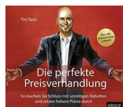
Cover Hörbuch „Die perfekte Preisverhandlung“