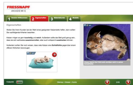
Screenshot aus dem e-Learning- Programm von FRESSNAPF