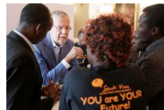
Teilnehmer von der Auma Obama Stiftung Sauti Kuu mit dem österreichischen Bundespräsidenten Alexander Van der Bellen