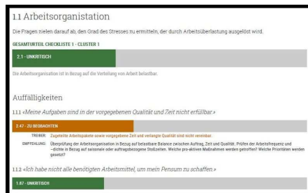
Beispiel Auswertungsgrafik bei RELIEF